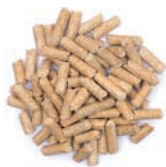
STALLPELLETS I SMÄSÄCK